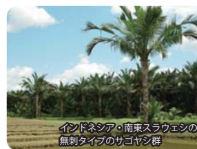
インドネシア・南東スラウェシの無刺タイプのサゴヤシ群