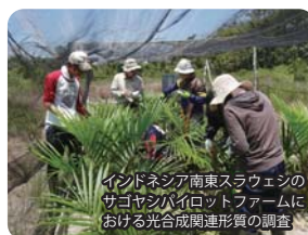
インドネシア南東スラウェシのサゴヤシパイロットファームにおける光合成関連形質の調査