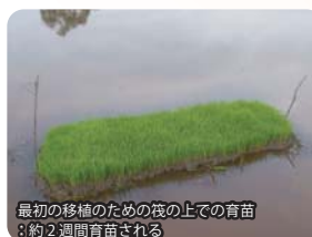
最初の移植のための筏の上での育苗 ：約2週間育苗される