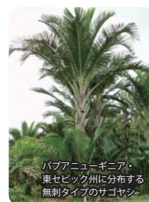
バブアニューギニア・東セビック州に分布する無刺タイプのサゴヤシ

私達の研究室では、サゴヤシがどのようにして塩害土壌や酸性土壌に適応しているか、そのメカニズムの解明に取り組むとともに、フィールドでの生育追跡調査を通じてサゴヤシの安定的栽培管理技術の開発に当たっています。また、国際共同研究としてリモートセンシングによる生育面積の推定と栽培適応地の抽出、デンプン抽出残渣から甘味料を作り出す技術の開発、新技術が社会経済に与えるインパクトの推定に取り組んでいます。