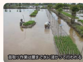
苗取り作業は腰まで水に浸かって行われる

私たちは、半島マレーシア西岸やスマトラ東岸地域の低湿地において行われてきた多回移植栽培を改めて技術的に評価するとともに、現地で栽培されてきたイネ品種の冠水に対する生育反応の調査を通じ、水深と深水期間が異なる地域で冠水への適応として稲体が具備すべき形質を明確にして、伝統的な技術を基本として洪水常襲地における稲作の安定化を目指し、冠水ストレスの軽減と被害からの回復を促すための肥培管理の改善など栽培技術の高度化に取り組んでいます。