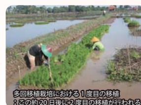
多回移植栽培における1度目の移植 ：この約20日後に2度目の移植が行われる